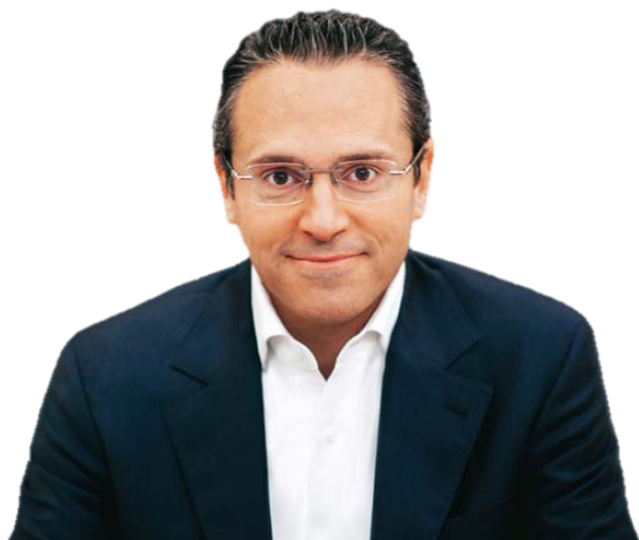
Wael Sawan CEO

Vă mulțumim pentru angajamentul dvs. față de etică și conformitate.